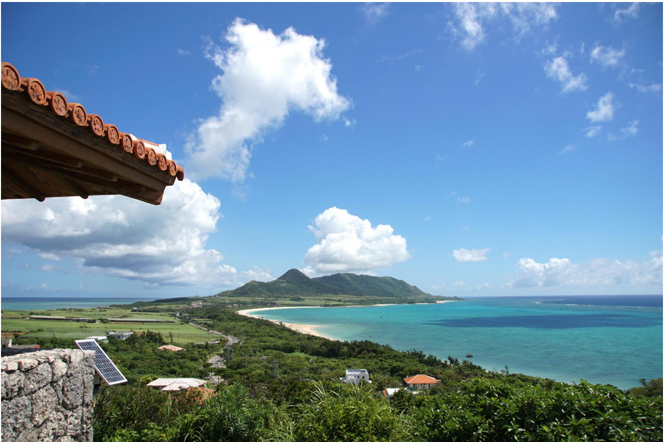
石垣市伊原間キャンプ山 2-9 1