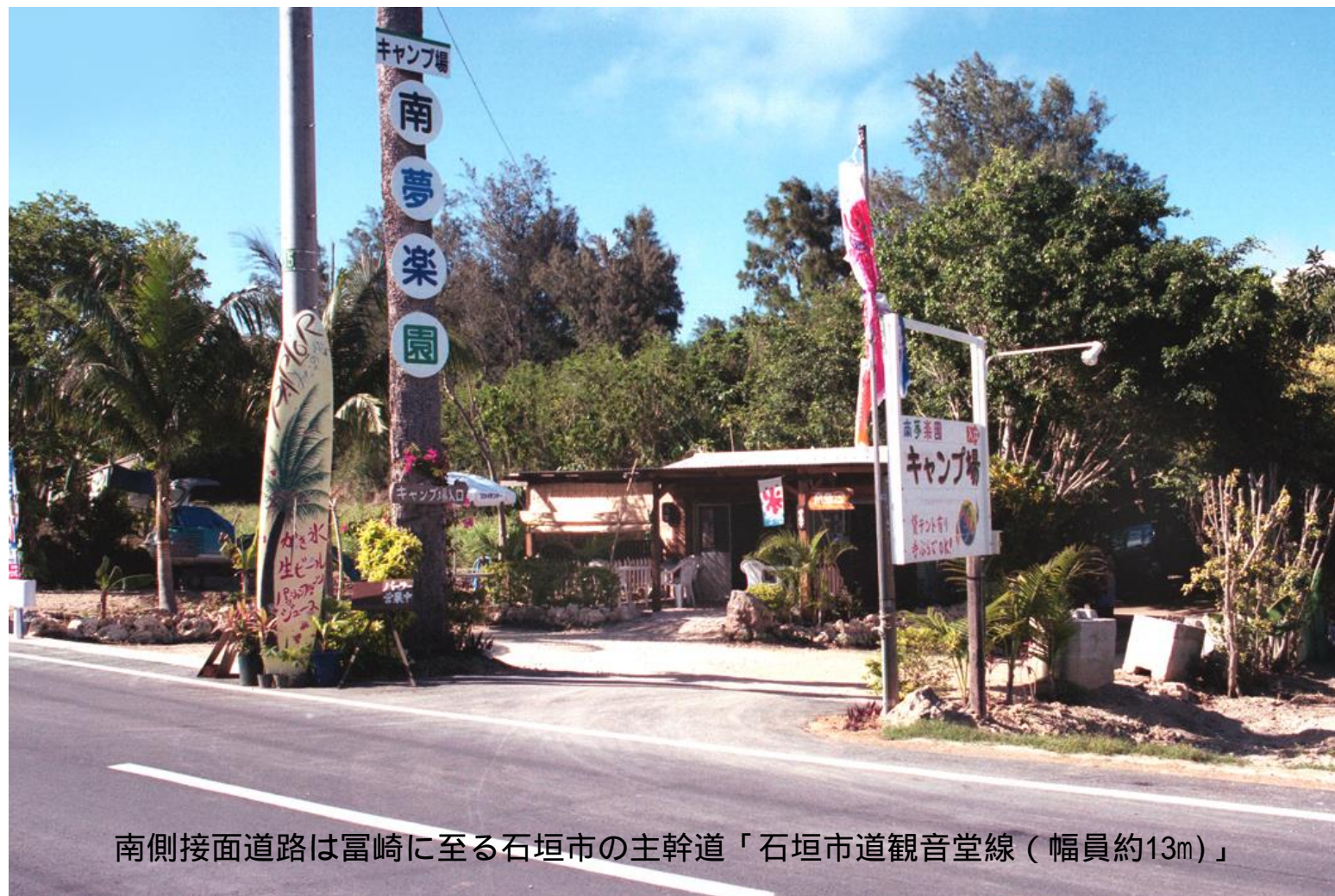
南側接面道路は富崎に至る石垣市の主幹道「石垣市道観音堂線（幅員約13m）」