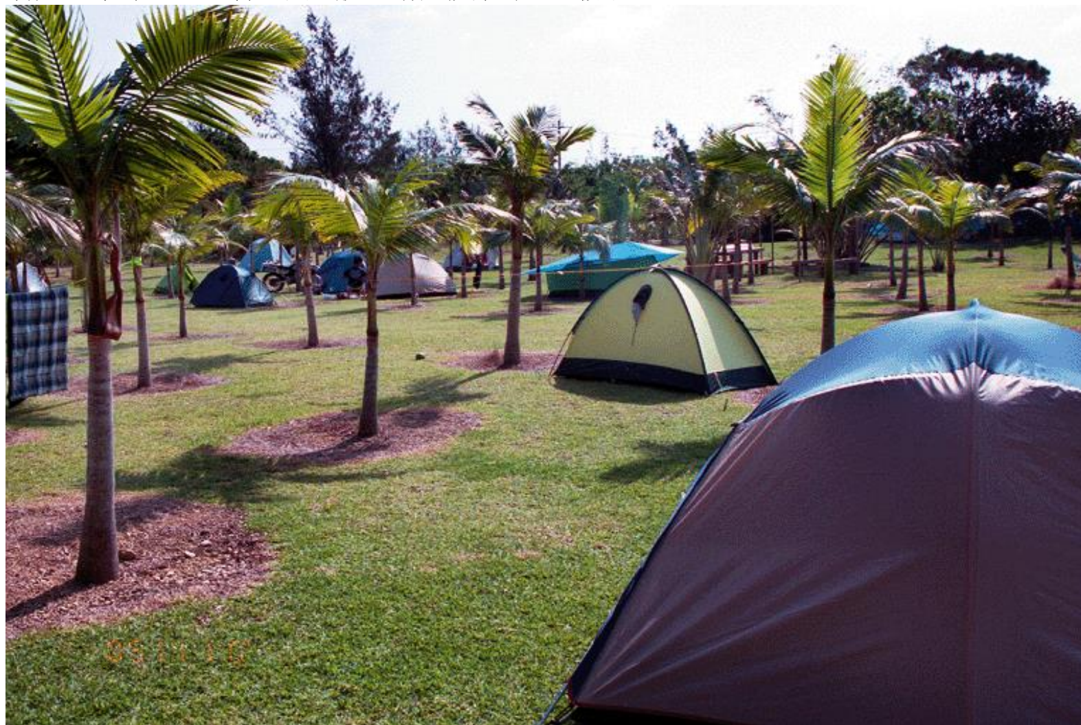
平成13年（2001年）当時の敷地点景 傾斜は極めて緩やか